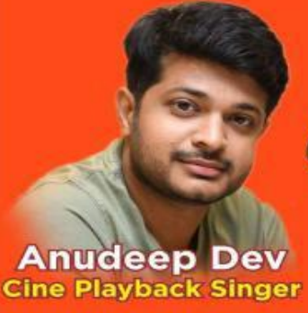
Anudeep Dev Cine Playback Singer