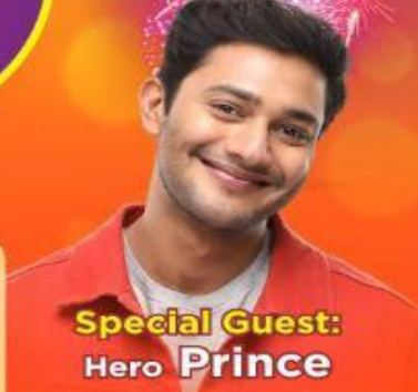
Special Guest: Hero Prince

Saturday, 19 th November 2022, 3pm EST onwards Venue: J.P. Stevens High School 855 Grove Avenue, Edison, New Jersey 08820