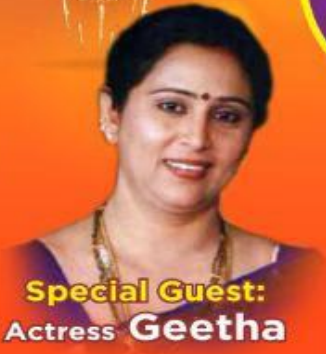
Special Guest: Actress Geetha